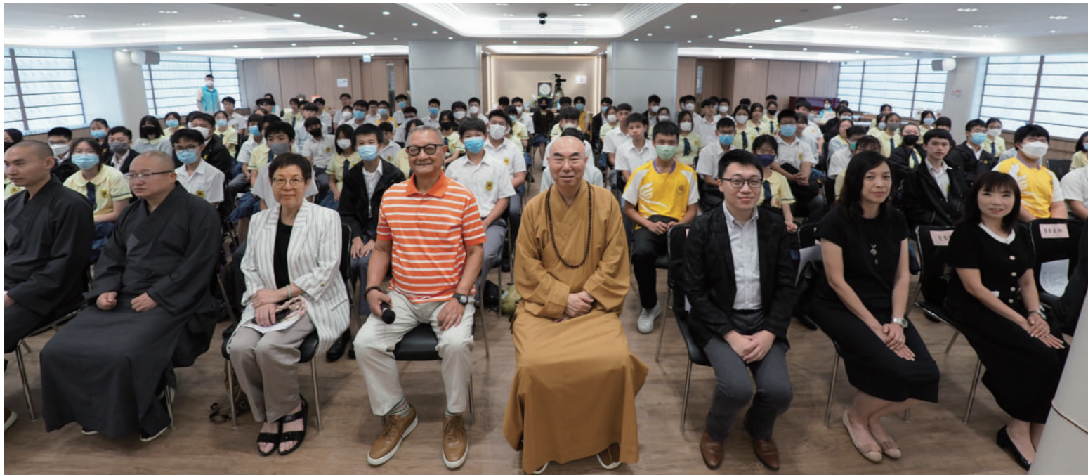
《溫暖人間》與普賢道場首度合作弘法利生的活動，以輕鬆手法接引年輕人。

普賢道場坐落於灣仔鬧市之中，道場大殿莊嚴殊勝，壁龕中嵌入普賢菩薩的琉璃像磚，熹微的晨光透過菩薩像映照進來，在正面的木刻浮雕畫上，一眾菩薩、護法、童子站在祥雲間，中心的普賢菩薩端坐於白象身上。帶着期待步入，學生們一早已安坐在法堂裏，在這安靜祥和的環境中，普賢道場住持寬運法師笑容可親，注視着朝氣蓬勃的一眾師弟妹，盡顯愛護之情。