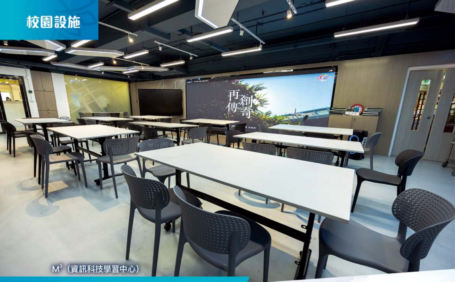
M 3 (資訊科技學習中心)