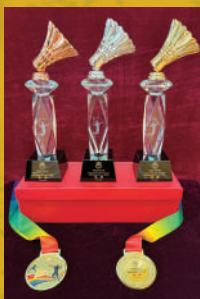
冠軍 3A 容楚謙

頗高，戰況激烈，親子合作無間，氣氛愉快。對本會頒發的獎杯及獎品亦表示滿意及開心。