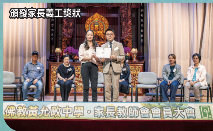
頒發家長義工獎狀