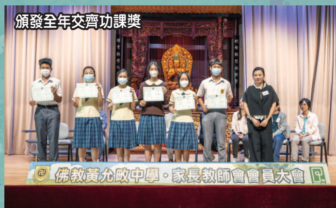
頒發全年交齊功課獎