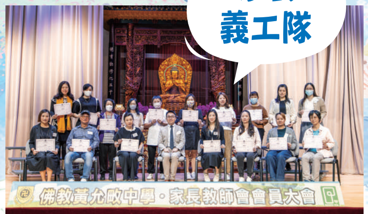
佛教黃允畝中學·家長教師會會員大會