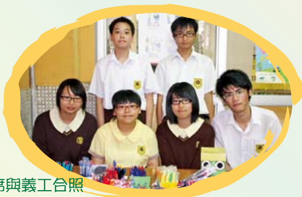
代表會主席與義工合照